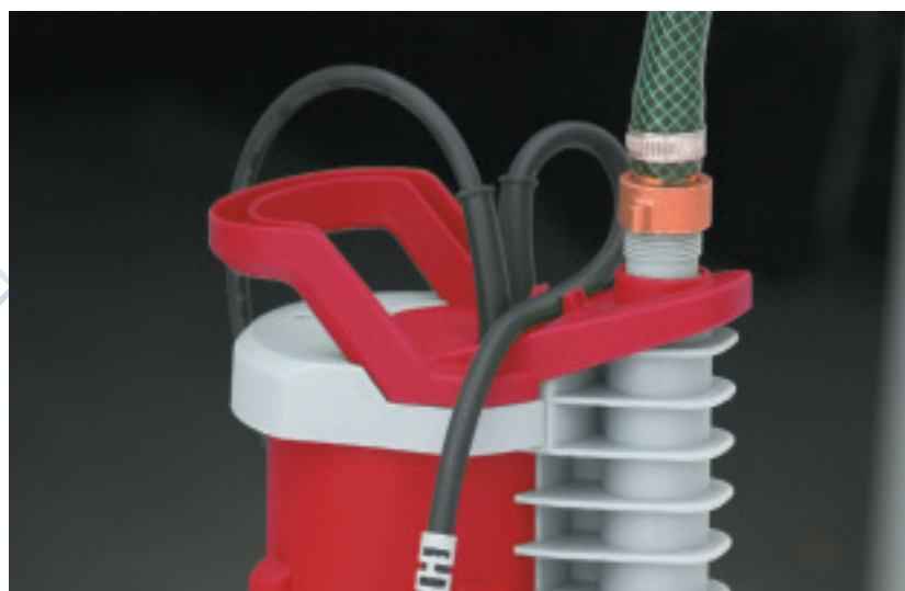
Připojení zahradní hadice

Součástí komory čerpadla TROPIC 550-2 je jemný filtr, který lze jednoduše čistit po sejmutí zámkového krytu a propláchnutím.