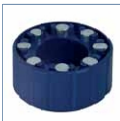
Kroužek s magnety

BravoTHERM 100 je magnetický filtr na odlučování nečistot s cyklónovým separačním systémem, který pracuje s pomocí silných magnetů zabudovaných v zařízení a zachycuje kaly, nečistoty a oxidy kovů. Díky svému principu fungování, tj. dekantace, BravoTHERM 100 není ovlivněn ucpáváním a nevyžaduje častou údržbu. Velmi snadné použití tohoto inovativního odlučovače nečistot umožňuje provádět čisticí operace bez nutnosti vyjmutí součásti ze systému. BravoTHERM 100 je kompletně vyroben z technopolymeru, speciálně navrženého pro vysokoteplotní hydraulické aplikace. Uvnitř odlučovače nečistot je umístěna filtrační vložka z nerezové oceli o tloušťce 500 µm. BravoTHERM 100 je vybaven 8 silnými válcovými neodymovými magnety umístěnými v sedlech spodního odnímatelného knoflíku. Max. teplota vody 90 °C - max. tlak 3 Bar