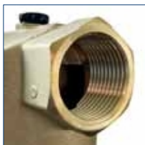
Závít podle EN 10226-1 a Normy EN 228-1

Čištění filtru lze snadno provést pouhým otevřením vypouštěcího kohoutu.