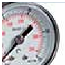
Odolává teplotě až 90 °C